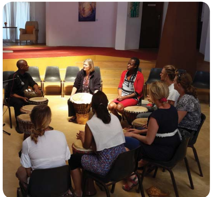
Föreningen SOFIA och Novalis Ubuntu Institute har samarbetat i många år. Bilden ovan är från en studieresa som SOFIA gjorde under 2014 till Kapstaden.

Mellan seminarierna finns det möjlighet att fortsätta diskussionen och ställa frågor som dyker upp via ett diskussionsforum på internet.